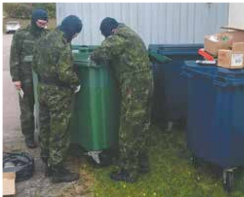
Affaldscontainer gennemses for effekter.

Alle fremmødte RYDASS'er bestod prøverne, og de er dermed godkendt for endnu et år.