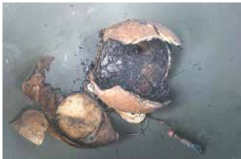
Resterne af en 4" luftbombe efter at den er åbnet med et skud fra NEUTRIX, og krudtet er blevet afbrændt.