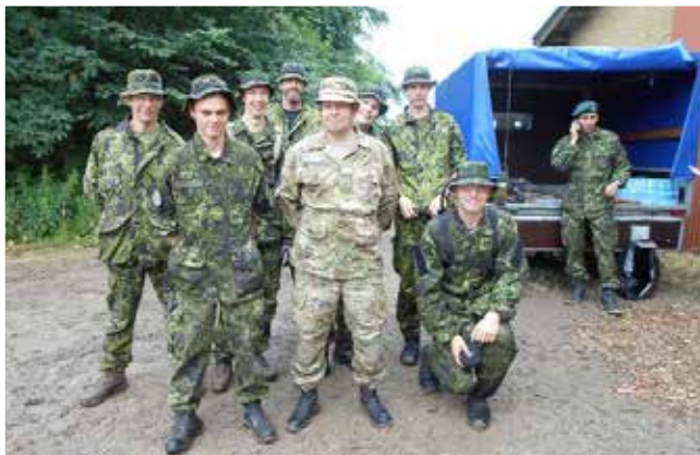
Vinderholdet fra HVK Midtfn

Buddy teams giver fordele. Fredag den 1. juli startedes op med øvelser i Buddy Teams (2-mands hold). Det er utroligt, så meget to soldater er i stand til at støtte hinanden i kampen. 18 hold blev sendt ud i det midtfnyske terræn. Opgaverne omfattede skydning med gevær, observation i terrænet, terrænløb på en afmærket rute, og en række andre discipliner. For eksempel ved skydning, kan makkeren hjælpe med at forbedre sigtet, og at måludpege i terrænet.