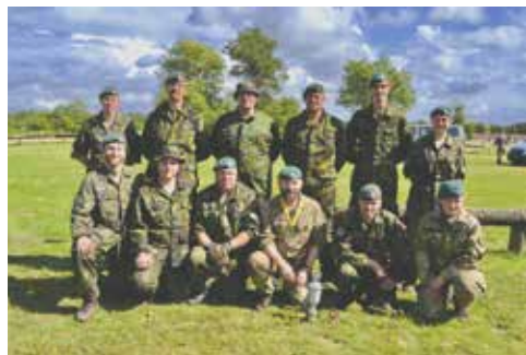
Vinderne: HVK Svendborg