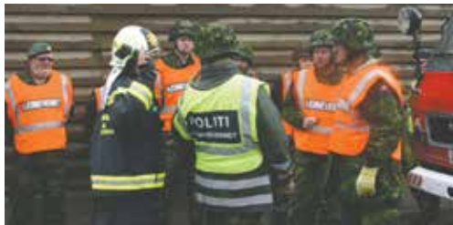
Øvelse Søkat 2011

Og beredskab, det kan de på Ærø. Jeg har selv haft to gode oplevelser. Da Fyns Politi besluttede at holde katastrofeøvelse på Ærø - på værftet i Søby, som har bygget mange af Marinehjemmeværnets fartøjer, hvor der øvelsesmæssigt var sket en kæmpe eksplosion, brand, mange kvæstede, mennesker blæst i havnen og så videre, var det ærøske hjemmeværn selvfølgelig en markant del af beredskabet. Og da Hendes Majestæt Dronningen besøgte øen var der næsten en hjemmeværnssoldat på ethvert gadehjørne for at deltage i sikkerhedsapparatet. Politi, brandfolk, ambulancefolk, lægefagligt personale, der flyves ind med forsvarets helikoptere - og selvfølgelig det ærøske Hjemmeværn.