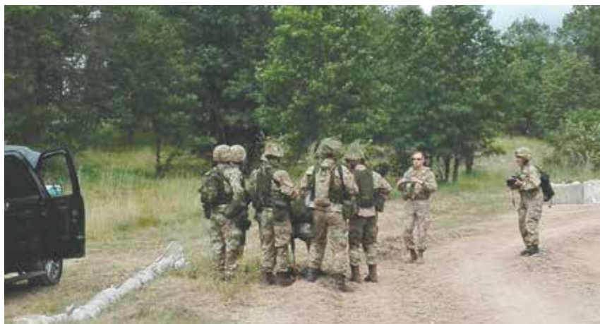
En generalmajors besøg bliver forevigtet af både National Guard og Hjemmeværn.

Da vi kom til Camp Grayling havde vi lagt de oplevelser bag os og indstillet vores holdning til positiv, men vores moral kom alligevel til at lide nogle alvorlige knæk hen ad vejen.