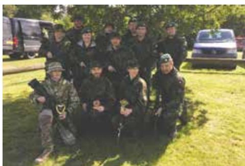
2.plads: HVK Odense-Havn (2)