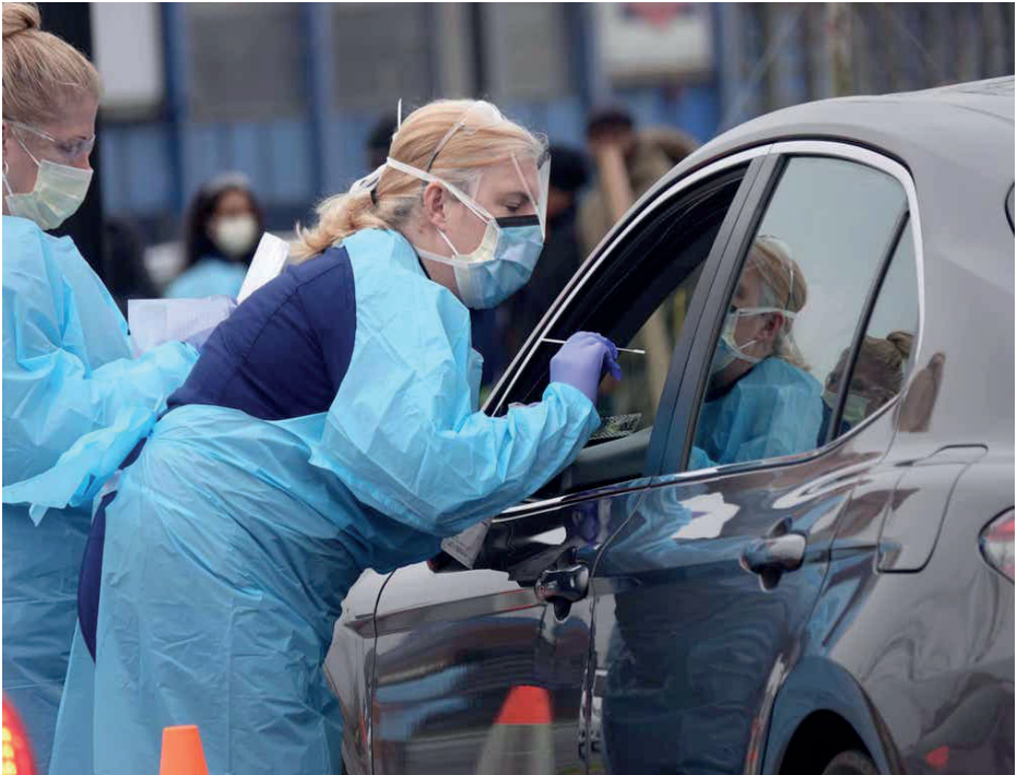
PCR-test gennem bilvinduet. Testcenter Kolding Sygehus.