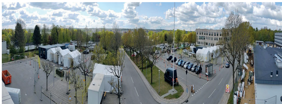
Testcentret ved Kolding Sygehus var delt i fire afsnit, baseret på telte på begge sider af den gennemgående vej. Hjemmeværnet viste vej og hjalp folk efter behov.

I det tidlige forår 2021 dukkede den indiske deltavariant op. Den var endnu mere smittefarlig. Myndighederne opretholdt restriktionerne, intensiverede testningen og søgte på alle måder at øge vaccineleverancerne, så man gennem vaccination hurtigst muligt kunne opnå flokkimmunitet i befolkningen.