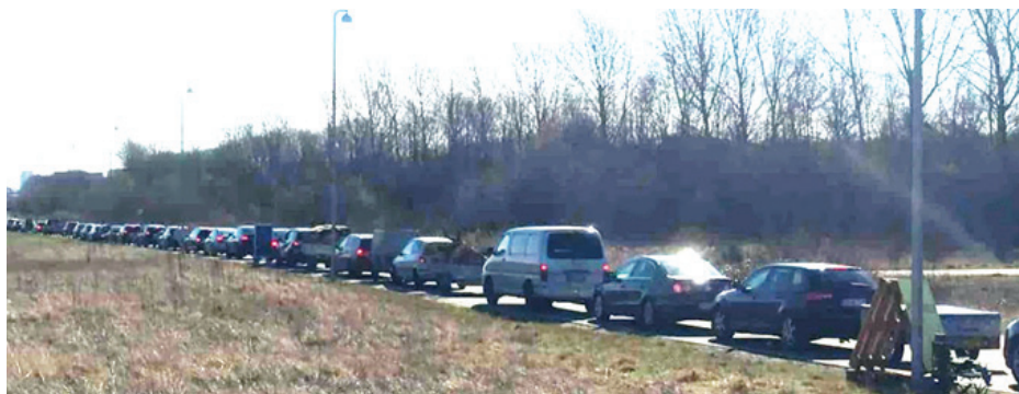
Der var lange køer, da genbrugspladserne genåbnede. Her fra Vejle.