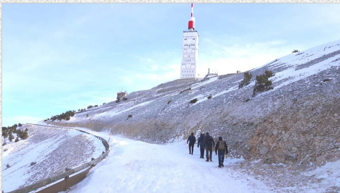
På vej op ad "det skaldede" bjerg, Mont Ventoux (kendt fra Tour de France)