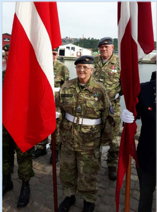
Valde og Cleo m/fanen 15. juni 2017

Velkommen til eskadrillen og til 77'eren