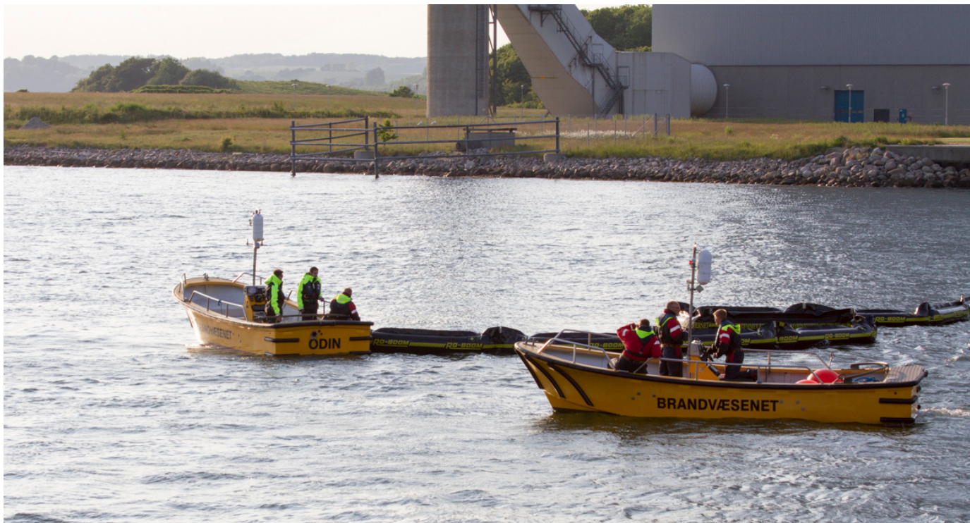
Fredericia Brandvæsen er ved at ankre flydespærringen op fra SPEDITØREN

Det nordlige Lillebælt og Kolding er ikke kun kendt i sejlerkredse for den naturskønne område. Det er også kendt for de særlige strømforhold, der hersker i området. En del Fyn rundt-sejlere har f.eks. fået strømmen at føle, når de flere gange har passeret Den gamle Lillebæltsbro for sejl.