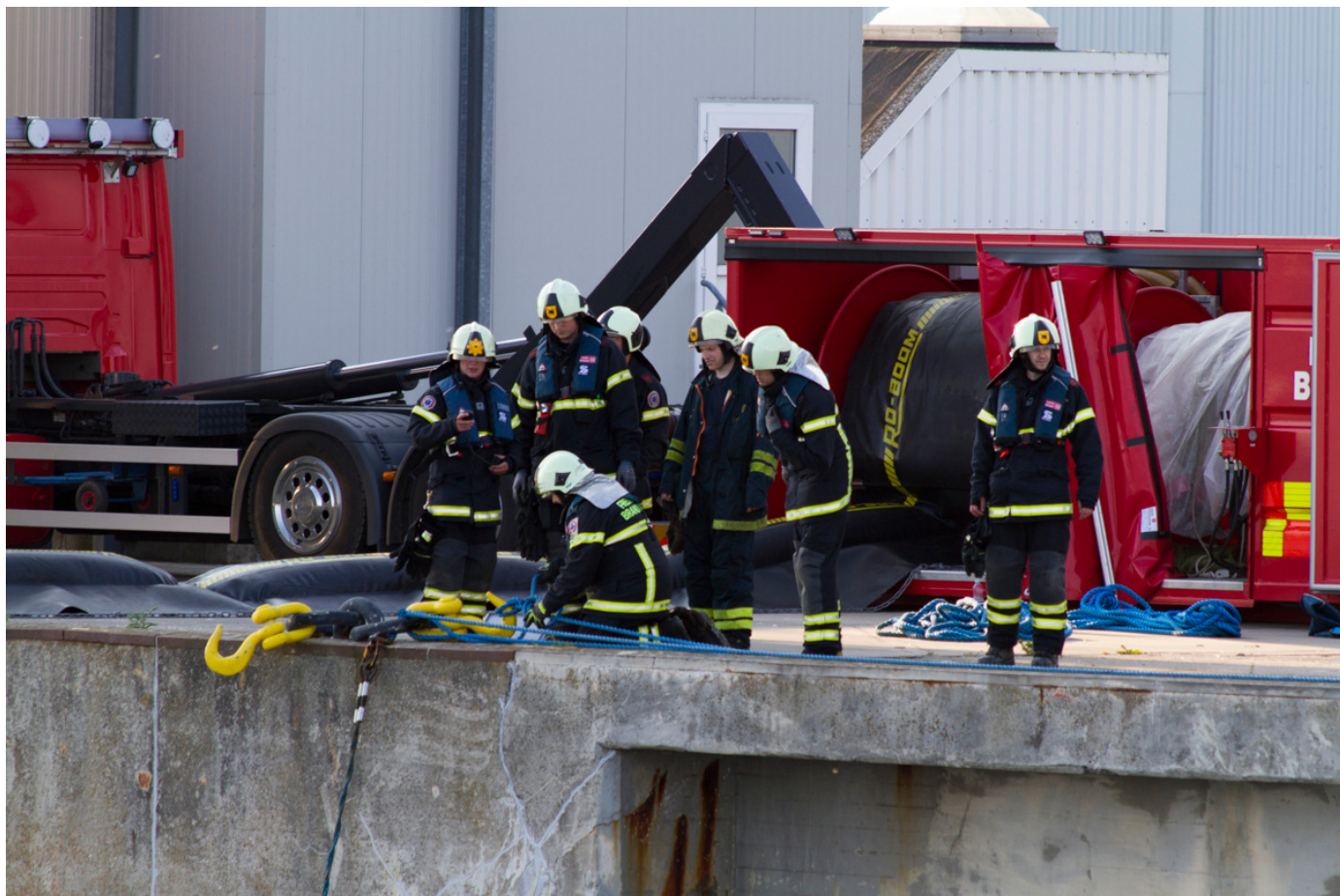
Beredskabet kæmper med at få hold på 160 meter flydespærring i den stærke strøm

Med ekstra hjælp fra Brandvæsnet fik vi dog sat 160 meter flydespærring i en vinkel, der var tæt på 90 grader på strømretningen. Måske ikke den optimale løsning, men det lykkedes.