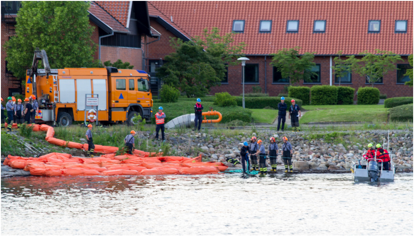
Det statslige beredskab sætter flydespærringer ud