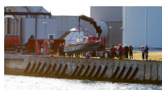
Det statslige beredskabs båd sættes i vandet