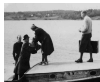
Jøder med deres vigtigste ejendele på vej i båden til Sverige.

Hent PDF/folder fra særudstillingen om jødetransporterne. - Klik her