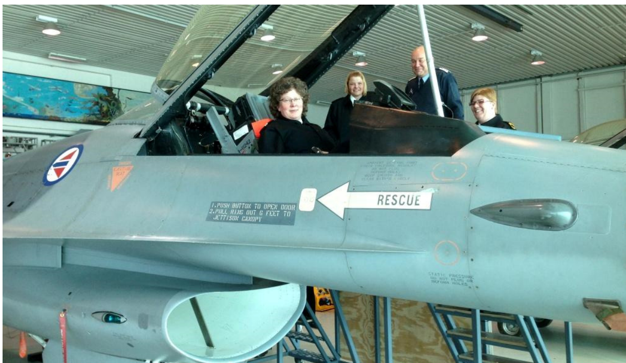
Her tre blå "sø-piger" og chefen fra flyvestationen i Kjevig lufthavn.