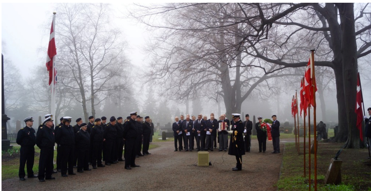
Parade og mindetale for de omkomne søfolk på Kristiansand Kirkegård.