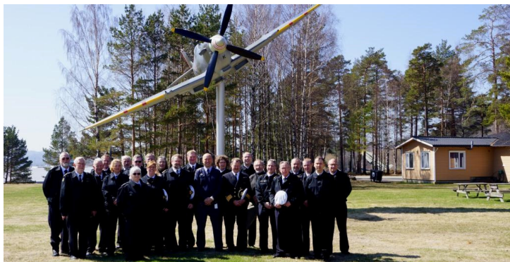
Et samlet billede fra en flot rundvisning på flyvestationen ved Kristiansand (Kjevik), under SPITFIREén. Alle fik en rundvisning og briefing.