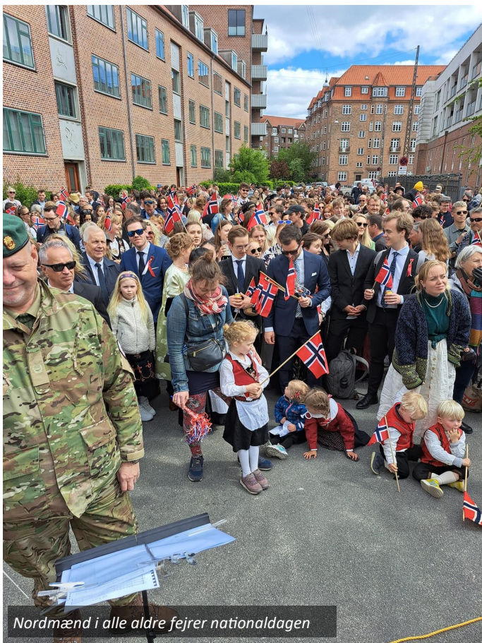
Nordmænd i alle aldre fejrer nationaldagen

Resten af orkestret sluttede sig til senere og vi marcherede i samlet flok fra Frelserkirken til Sjømannskirken på Amager mens vi bl.a. spillede norske melodier og der blev råbt "Hip hip hurraaaa". Sikke en vrimmel og sikken dejlig stemning!