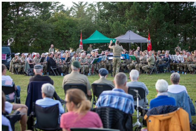
Afslutningskoncert på Skaven Strand