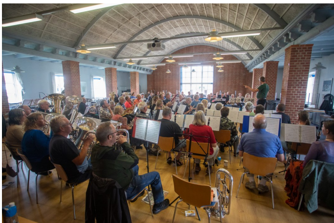
Harmoniorkestret øver indendørs i den gamle spisesal