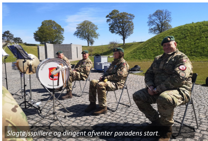
Slagtøjsspillere og dirigent afventer paradens start.