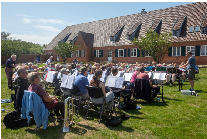
Harmoniorkestret på græs