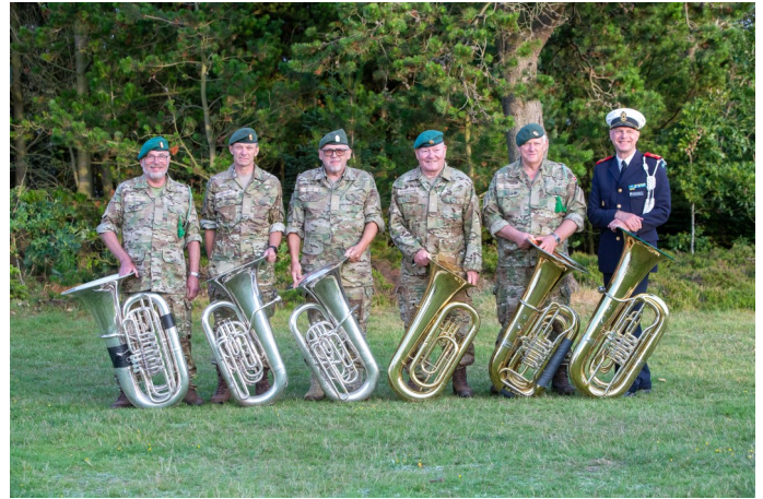
Tubagruppen fra harmoniorkestret