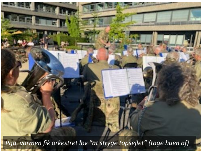
Pga. varmen fik orkestret lov "at stryge topsejlet" (tage huen af)

Traditionen tro afsluttede musikkorpset sæsonen med manér, da vi spillede i gården på Rigshospitalet. Rygtet vil vide, at man kan høre musikken helt op på de øverste etager og vi får tit at vide, at patienterne er meget begejstrede for det musikalske indslag.