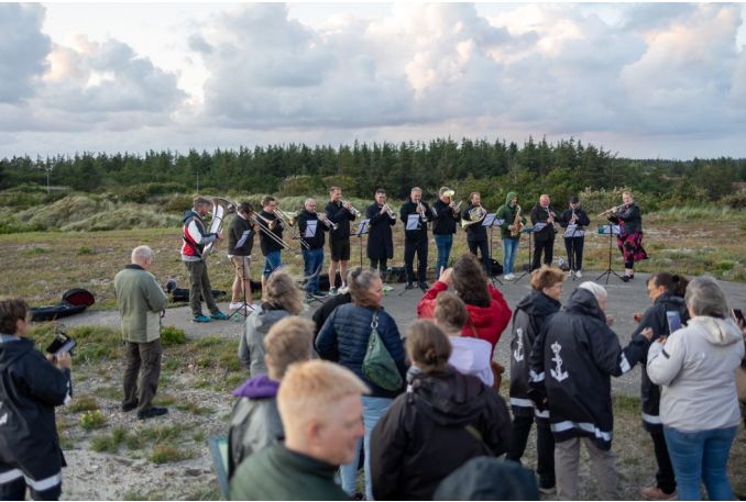
Lærerstabten spiller solnedgangskoncert for kursisterne

Musikkorpset dygtiggør sig ved at deltage i et 5-dages efteruddannelseskursus på Hjemmeværnsskolen i Nymindegab og mere end 2/3 af orkestret vælger at bruge en del af deres sommerferie på at deltage - så når sæsonen starter i august, er det med et velspillende og veloplagt orkester. I år slog deltagerantallet rekord og aldrig før har så mange spillet med i brass bandet og harmoniorkestret. Der undervises også i små grupper opdelt efter instrument af professionelle instruktører og også her, var holdene godt fyldt op.