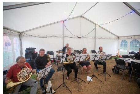
Forskellige ensembler valgte at optræde for hinanden. Her ses hhv. klarinetter, fløjter og horn