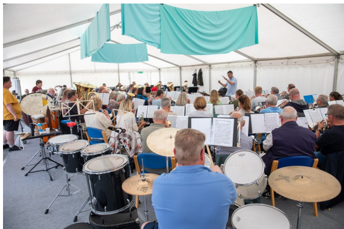
Brass bandet øver i et stort telt