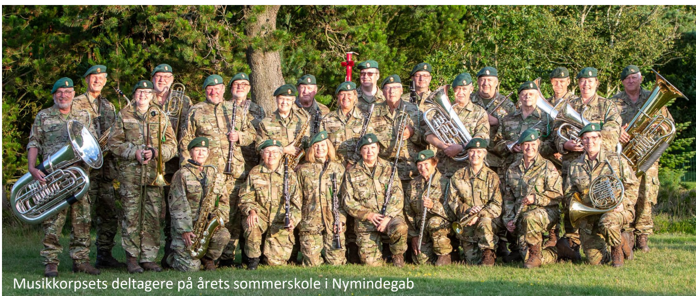
Musikkorpsets deltagere på årets sommerskole i Nymindegab

Rigtig god læselyst! Mange hilsner Musikkorps København