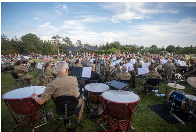
Afslutningskoncert på Skaven Strand