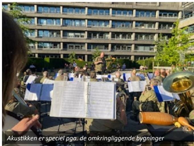
Akustikken er speciel pga. de omkringliggende bygninger