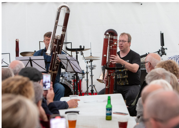
For første gang i sommerskolens historie deltog to kontra-fagotter