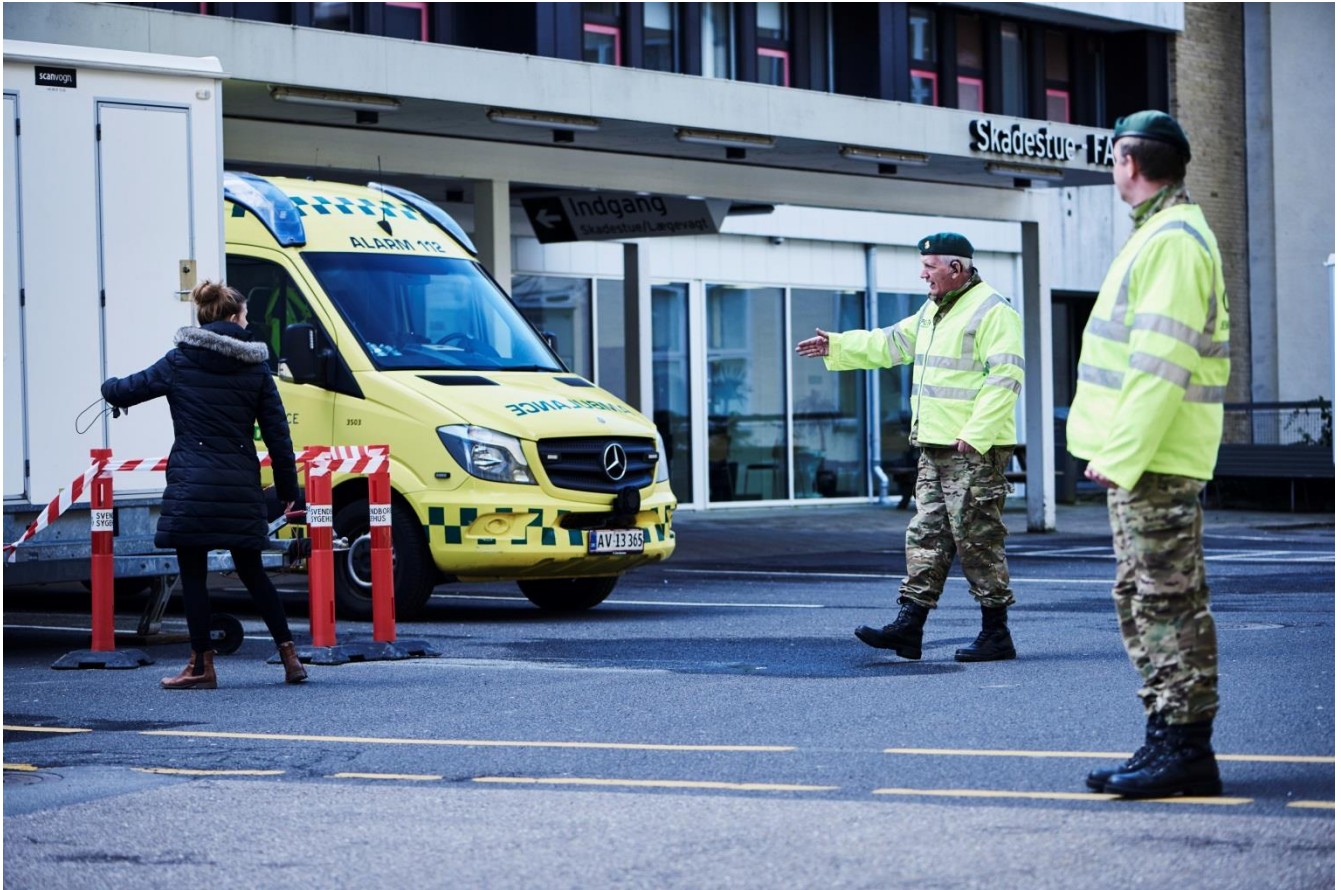
Støtte til sygehuse: Det var en helt ny opgave, da soldater fra Hjemmeværnet straks stillede op for at støtte sygehuse, der fik behov for en håndsækning til anvisningen af de mange borgere, der i bil strømmede ind til testcentre vedrørende COVID-19.