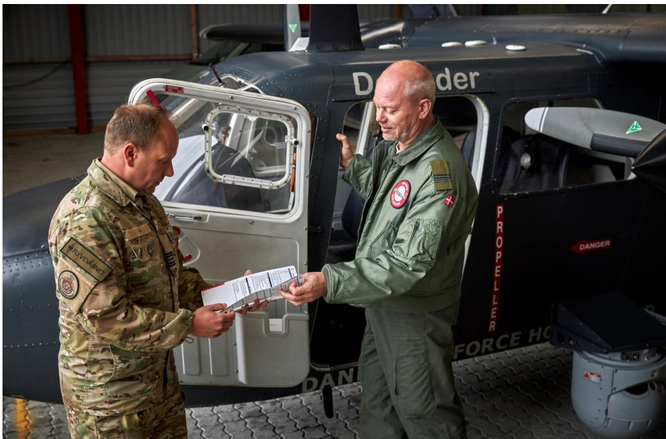
Klar til mission: Hjemmeværnet bidrog for andet år i træk til at løse en opgave for EU's grænse- og kystvagtsgentur - FRONTEX. Flyverhjemmeværnet stillede med et Defenderfly og i alt ni mand - otte frivillige fra Flyverhjemmeværnseskadrille 270 og en forbindelsesofficer - der i august og september 2020 var med til overvågning af migrationspresset og begrænse den grænseoverskridende kriminalitet ud for Spaniens sydkyst.

Hjemmeværnet deltager i internationale aktiviteter med henblik på at styrke og vedligeholde uddannelsesniveau og indsættelsesevne samt for at markere og støtte samarbejdet med Hjemmeværnets samarbejdspartnere. Aktiviteterne bidrager direkte til den fortsatte udvikling af Hjemmeværnet, hvor der eksempelvis i regi af det formaliserede nordiske skolesamarbejde, betegnet SAMSKANDIA, og visse dele af samarbejdet med de baltiske lande, betegnet SCANBAL, er gennemført uddannelses- og øvelsesaktiviteter, som efterfølgende kan omsættes til kvalifikationer/erfaring i den hjemlige struktur.