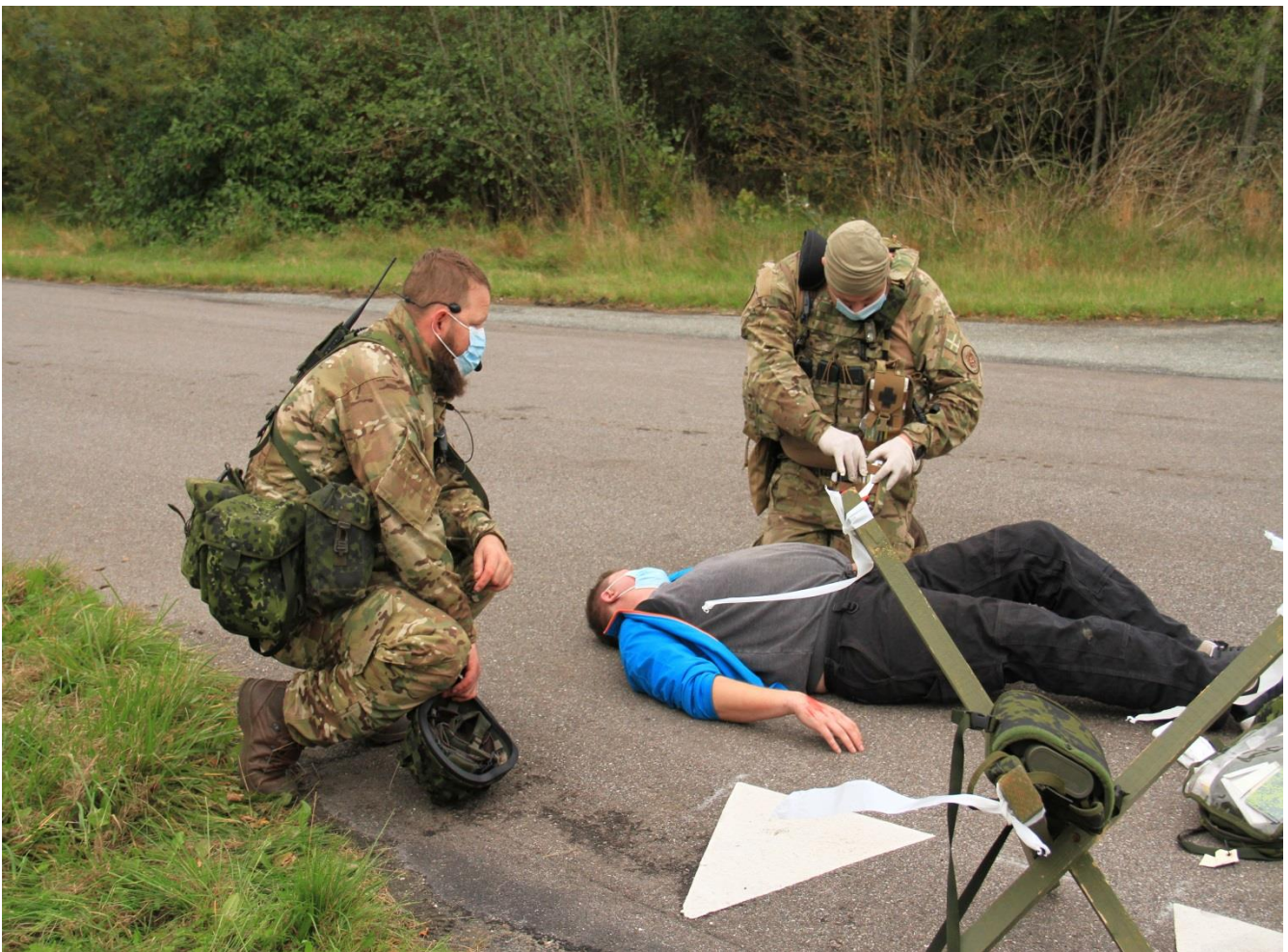
Førstehjælpstræning under COVID-19 restriktioner: Flyverhjemmeværnet gennemførte 25. - 27. september 2020 øvelse CIMBRER på Flyvestation Aalborg, hvor der bl.a. blev øvet samarbejde med Flyvevåbnets Air Transport Wing, og som billedet illustrerer, indgik der førstehjælpsmomenter for soldaterne på øvelsen. Alle aktiviteter blev gennemført under overholdelse af de særlige COVID-19 beskyttelsesforanstaltninger.

Økonomisk forventes 2021 at blive udfordrende. Således vil en række af de uddannelses- og aktivitetsmæssige forsinkelser fra 2020 som følge af COVID-19 blive søgt indhentet inden for de eksisterende økonomiske rammer. Den fortsatte udvikling af COVID-19 vil dog omvendt også kunne resultere i tilsvarende mindreforbrug på driften, som det er set i 2020.