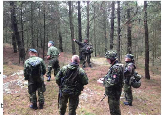
Rrcce ude i moder natur.

Forinden vores RECCE skulle OP-TI-SI være på plads, inden vi fik lov til at foretage den egentlige befalingsskrivelse, med tilhørende TN-bord. Efter aftenspisning gik befalingsudgivelsen på skift i syndikatet. Imellem befalingerne var der tilbagemelding på den enkelte befaling, både fra underviseren og resten af syndikatet.