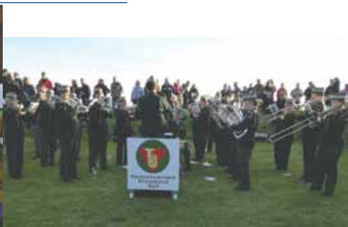
På bastionen i Nyborg