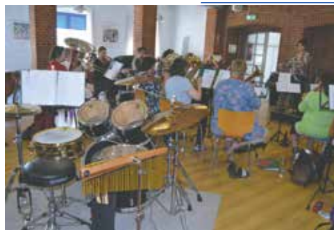
Der øves i Nymindegab