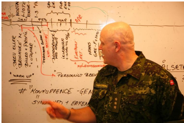
Planlægning og tankespind!