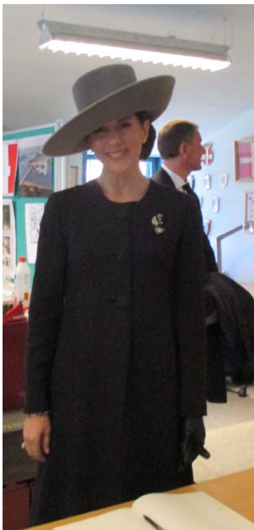
HKH Konprinsesse Mary's besøg hos Historisk Udvalg i Søgårdlejren 9. april 2015