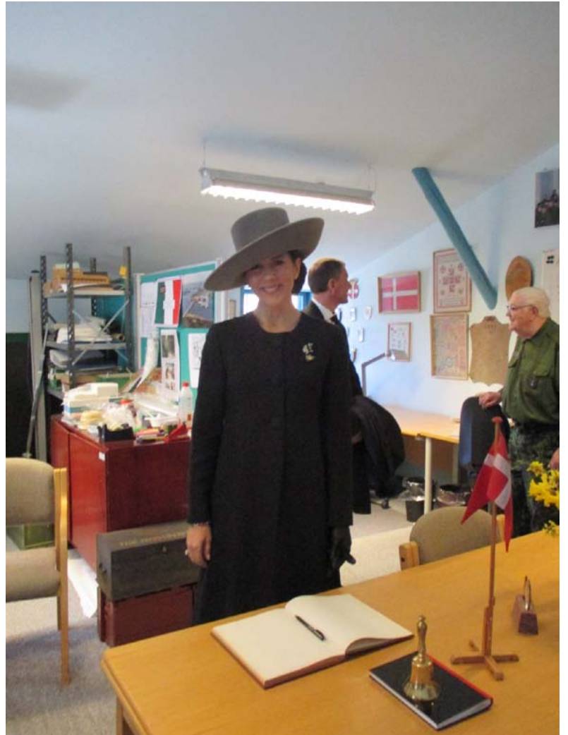
HKH Kronprinsesse Mary har skrivet en hilsen i Historisk Udvalgs gæsteborg.