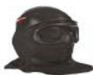
FX-MASKE m/sort plastik hjelm