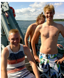
Uheldige men glade drenge om bord på LYRA på vej i sikker havn.

Til tonerne af bla. Marie Key, DAD og L.I.G.A. sværmede sejskibe, motorbåde, speedbåde og jetski rundt ude i Lillebælt. Og der blev ikke kun kontrolleret hastigheder. Politiet tjekkede også om sejlerne overholdt promillegrænserne, om de havde speedbådsattestaterne i orden, og om der var redningsvest til alle om bord.