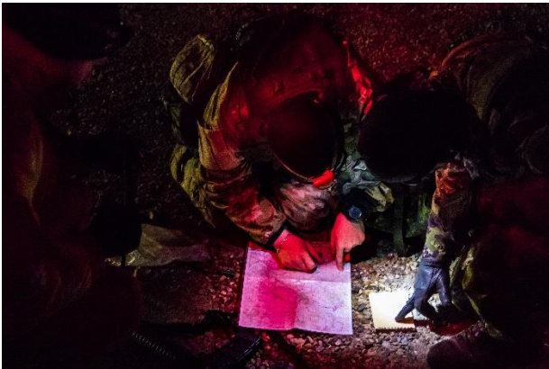
Forberedelse af ruten til næste post, inden turen går gennem