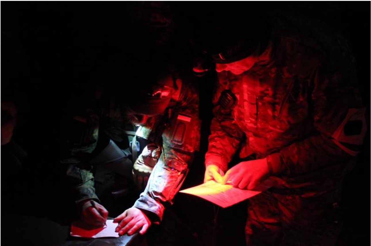
En af de tyske deltagere på hold 9 får post-instruks fra en af Hjemmeværnetsoldaterne fra Kolding

Og det var lige hvad holdet gjorde – hurtigt og effektivt fulgte de kablet, lokaliserede et brud og fik det repareret. Derefter hurtigt retur til udgangspunktet, hvorfra sprængningen kunne gennemføres med succes. Holdet høstede stor ros for deres hurtige og effektive arbejde – der var stor tilfredshed hos arrangørerne.