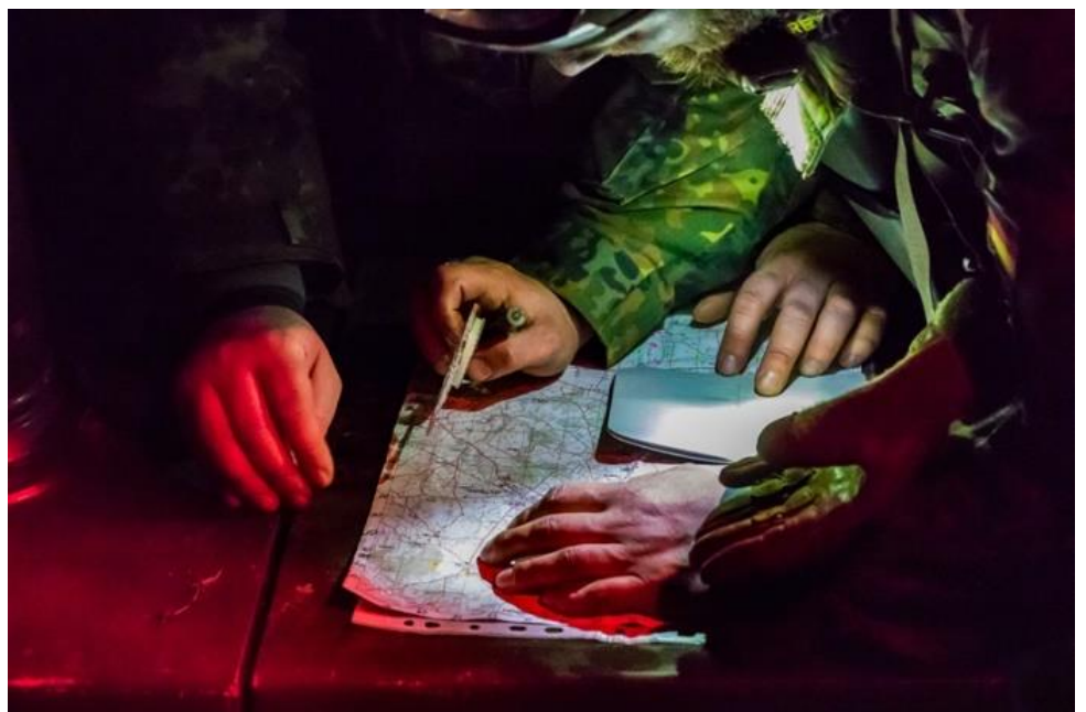
Kortet nærstudies for at finde næste post