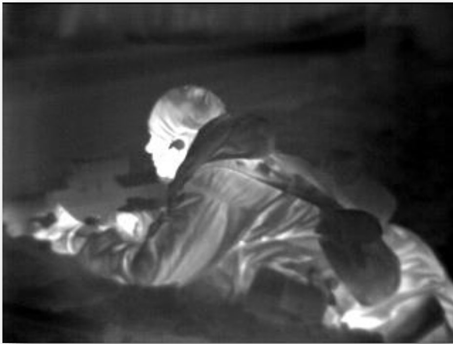
En soldat på vagt en mørk aften et sted på Bornholm.