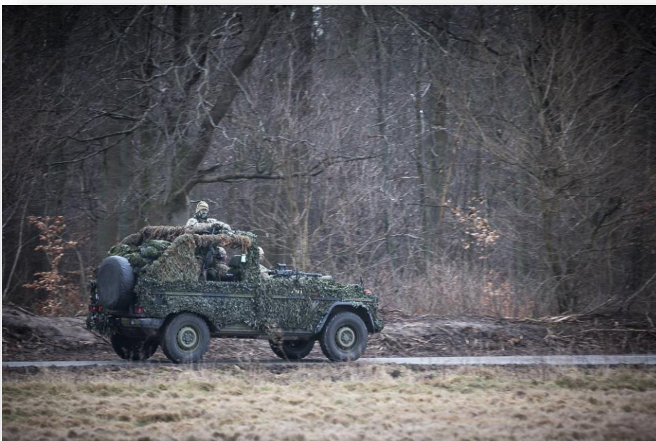
MOTOV under deres uddannelse på Sjælland