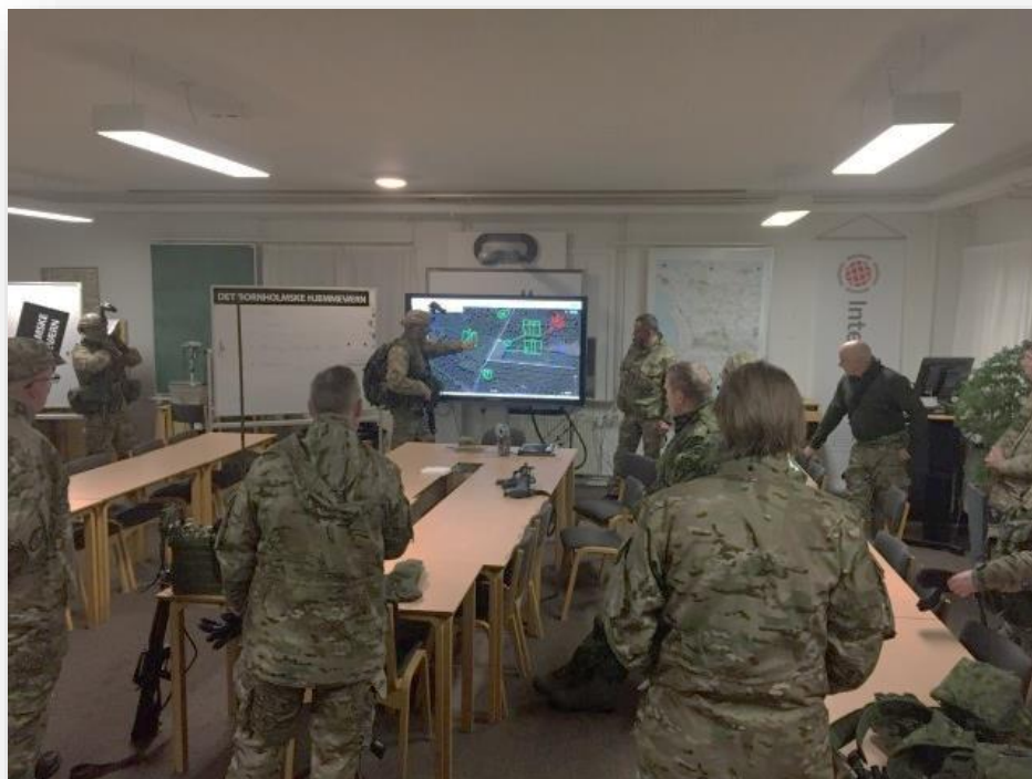
Afsluttende koordinering inden påbegyndelse af opgaveløsning