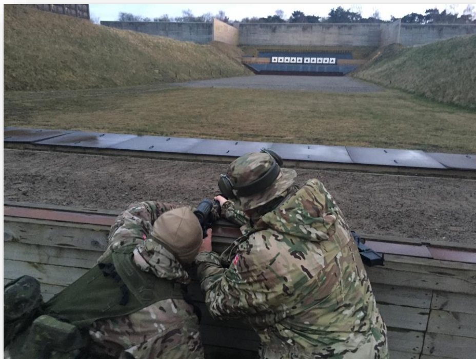
Indskydning af nyt sigte. Ja der er nok at tage sig til i Hjemmeværnskompagni Hasle