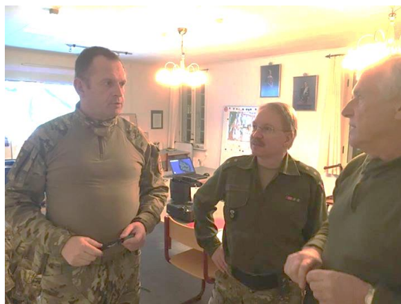
Personel fra Frivillig stab i action under POHVK A-øvelse