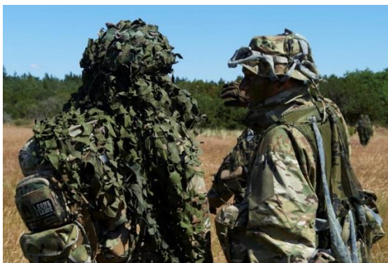
Slørings specialist kurset i gang, et af vores flexmoduler.