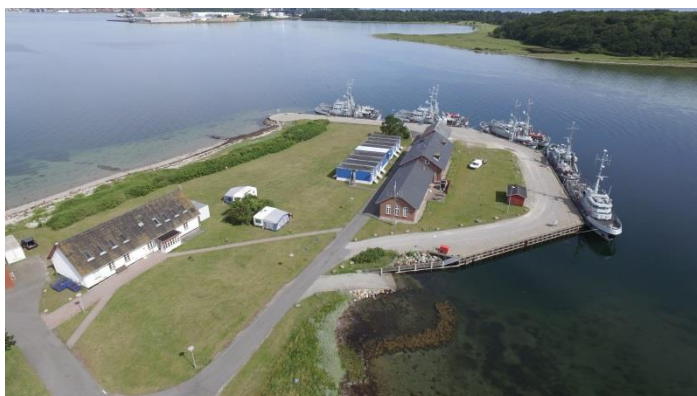
Slipshavn fra oven