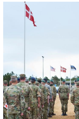
Flagparade afholdes hver morgen