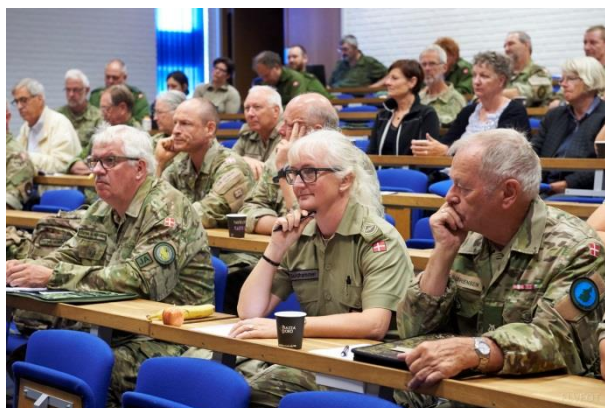
Foredrag fra Sikkerhedspolitisk kursus

OBS: Sikkerhedspolitisk kursus vil dog blive udbudt under Sommerkursus 2019.