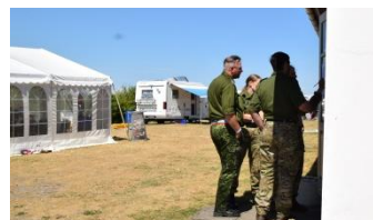
Du kan også tage værnfælleskurser under uddannelsesugen