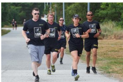
Sommerløbet er en fast tradition under Sommerkursus.

Ved at deltage på Sommerkursus får du udviklet dig fagligt, samtidig med at det sociale er i højsæde. Husk, at du må tage partneren og dine børn med i denne uge, så de kan få et indblik i hvad Hjemmeværnet og Hjemmeværnsskolen er for noget.