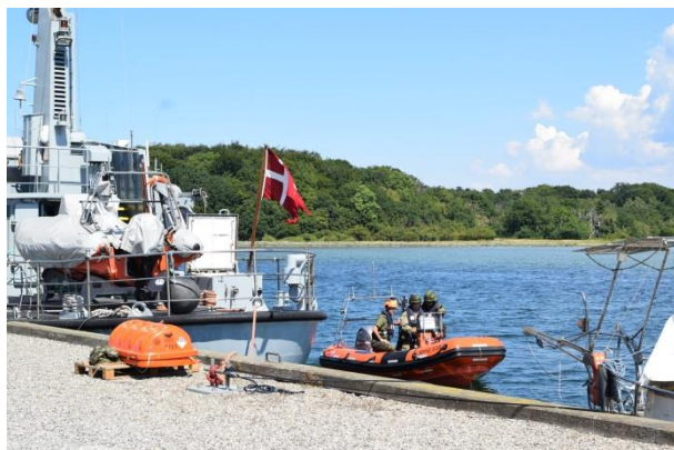
Maritim havnebevogtning fra LPU 3, et af de faste kurser under uddannelsesugen

I denne uge må du også tage din partner og børn med, og der bliver sørget for gode oplevelser for dem også.