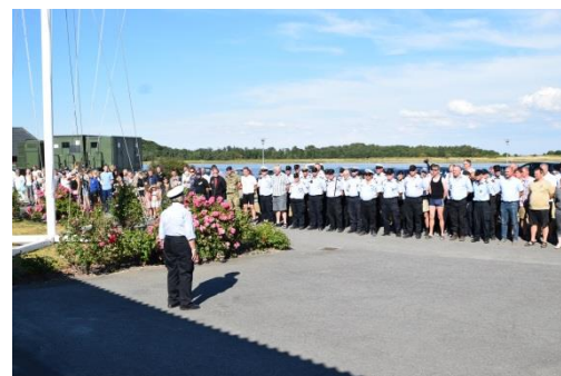
Mønstring finder sted hver morgen