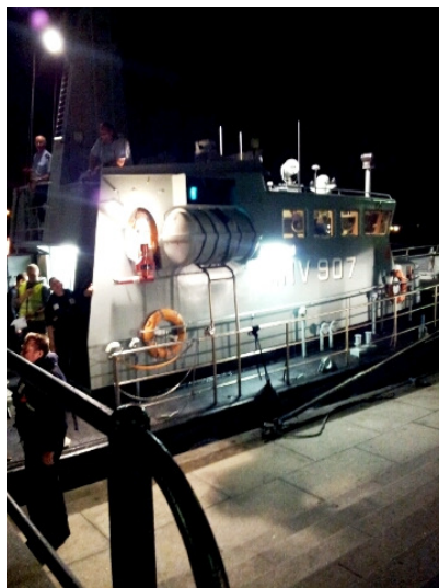
HVIDSTEN ved Nordre Toldbod.

Kort efter var skibet tomt, og efter en tid kom indsatslederen om bord igen efter en masse aktivitet på kajen. Da han var færdig med at rapportere nattens hændelser, var der debriefing på HVIDSTEN med politi, marinehjemmeværnet og besætningen på 'Rescue Lynetten'. Og der var roser for en professionel indsats.