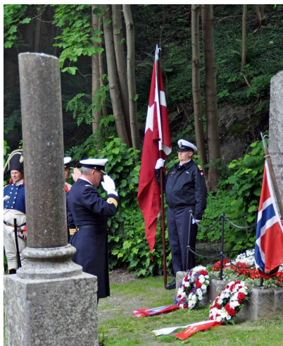
Kransenedlæggelse i mindelunden ved Risør.