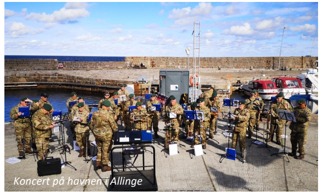
Koncert på havnen i Allinge