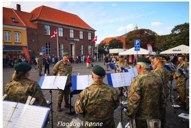
Flagdag i Rønne