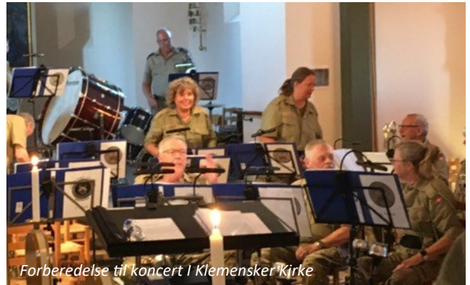
Forberedelse til koncert i Klemensker Kirke