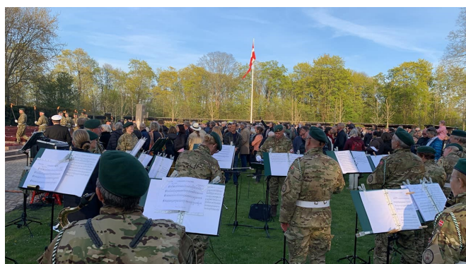
4. maj: Befrielseskoncert i Mindelunden i Hellerup