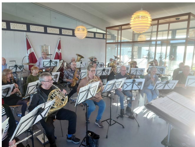
Øveweekend på Griben