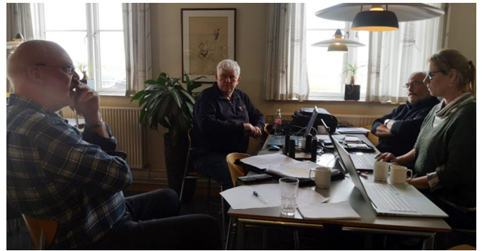
Befalingsmandsmøde i Slipshavn