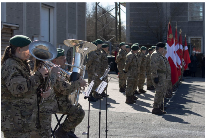
En trio spillede til kommandooverdragelse i Fredensborg 2. april

Mindre grupper fra musikkorpset stiller op, hvis lejligheden byder det. Eksempelvis kan en trio, en kvintet eller en enkelt trompetist blive kaldt ud og musikkorpset sætter en ære i at hjælpe, hvor vi kan.