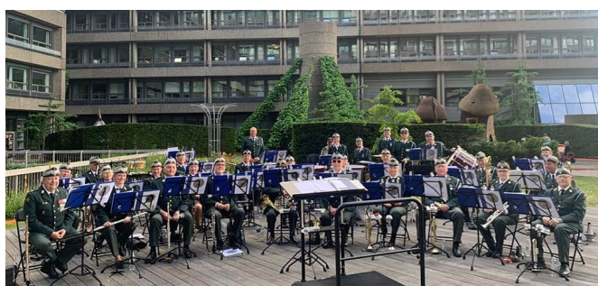
Sommerkoncert på Rigshospitalet