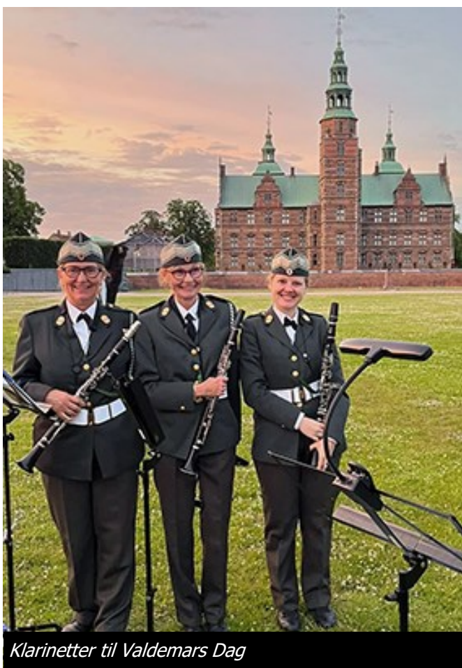
Klarinetter til Valdemars Dag