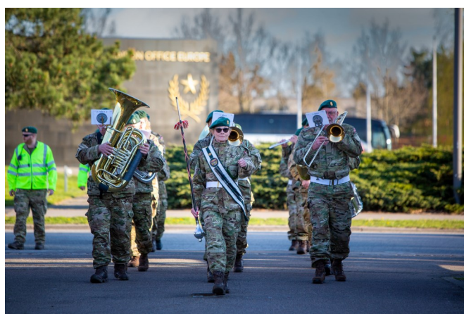
Marchtur ved årsprøven