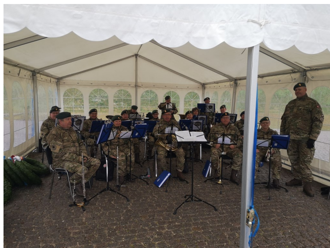
Nato-dag på Kastellet