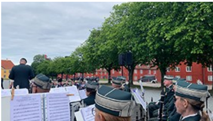
"Nytårskoncert" på Kastellet