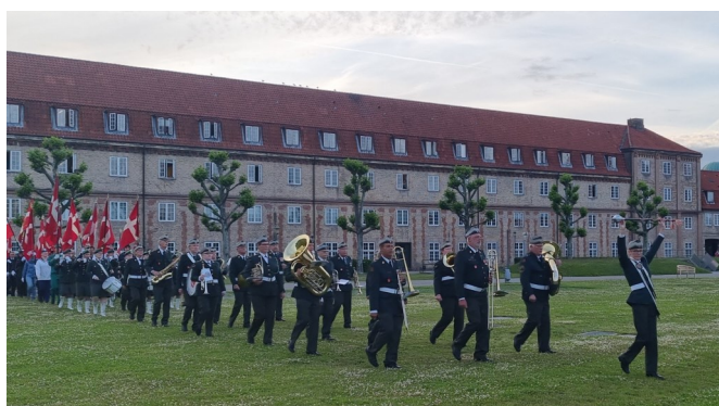
Marchtur og koncert i Kbh. på Valdemars Dag