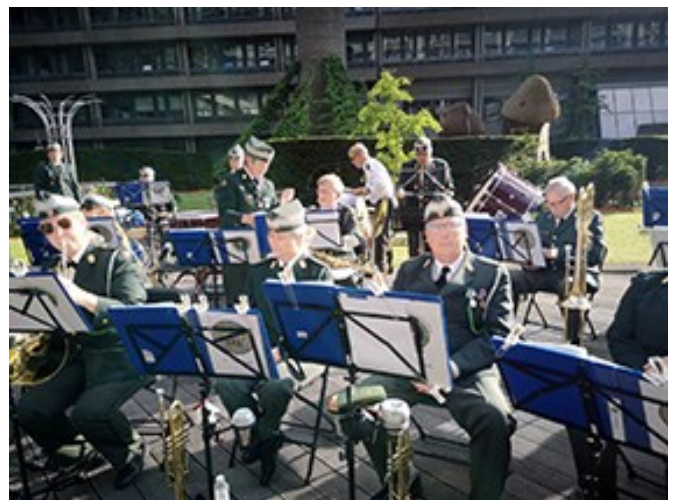
Sommerkoncert på Rigshospitalet