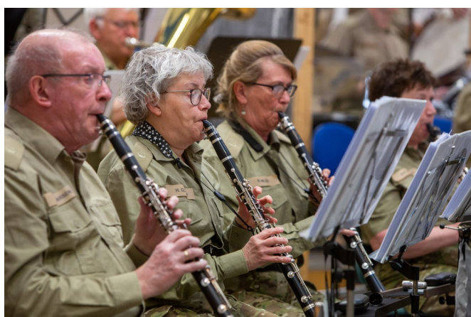
Lille koncert ved årsprøven